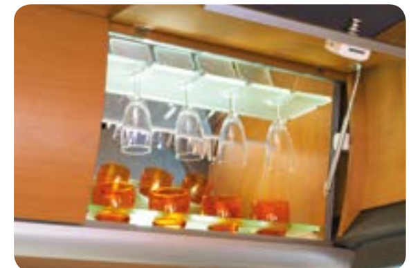
Eleganz bis ins kleinste Detail

Der repräsentative Gläser-Dachschrank mit integrierter Beleuchtung betont den luxuriösen Charakter des Star.