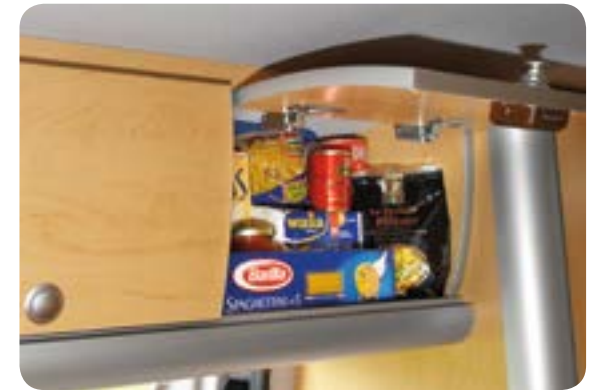
Viel Staufläche im Dachhängeschrank

Reichlich Platz für Proviant, Geschirr und Küchenutensilien bietet der Dachhängeschrank über der Küchenzeile. Alles in direktem Zugriff.