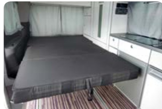
Komfortbett für entspannten Schlaf

Für ihren einzigartigen Liegekomfort bekannt: Die V3000-Schlafsitzbank mit topfebener Komfort-Schlaflfläche 200x118 cm.