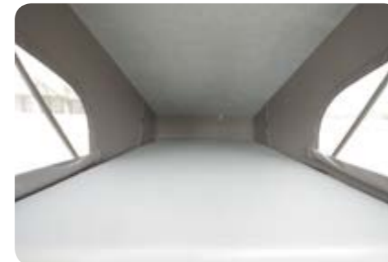
Für das Raumgefühl

Mit dem Schlafdach macht der Vito TrioStyle nicht nur äußerlich eine gute Figur. Zwei bequeme, zusätzliche Schlafplätze (Schlaflfläche 196 x 126 cm), die üppige Stehhöhe und ein angenehmes Raumklima gehören zu den vielen Vorteilen des aufstellbaren Reimo-Schlafdaches.