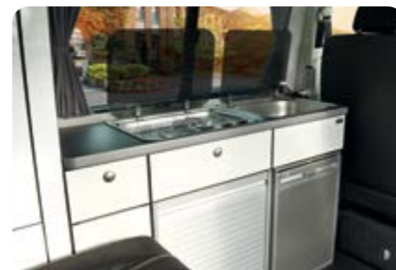
Küchenzeile für Genießer

Hochwertiger 2-Flamm-Kocher, Edelstahlspüle mit Wasserhahn, 40 l-Kompressor-Kühlschrank, Staufächer für Geschirr, Besteck und Lebensmittel - alles an Bord.