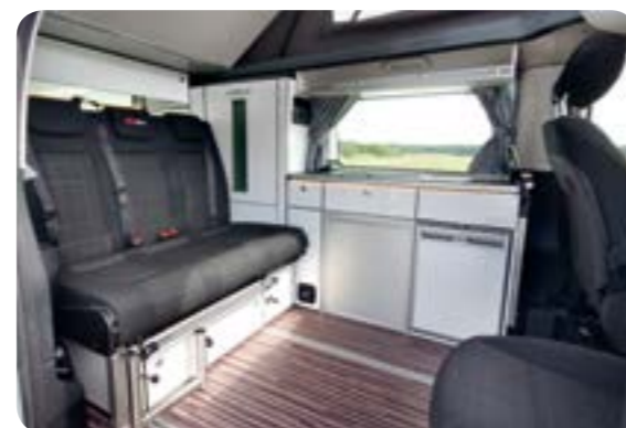
Möbelzeile der Extraklasse

Perfektion in Form und Funktionen: Die exklusive Möbelzeile glänzt mit ausgefeilten Lösungen und besten Materialien. Kleiderschrank, Wäschefach, Gasfach, ein Fach für die Campingtoilette - alles ist gedacht.