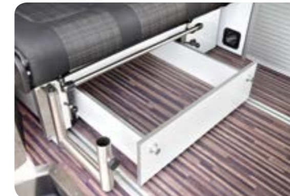
Auf Wunsch mehr Stauraum

Als Option bietet die geräumige Bankschublade bequemen Zugriff auf den Stauraum unter der Sitzbank, Stauvolumen ca. 95 Liter, z.B. für die Bettwäsche.