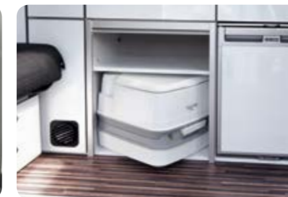
Stauraum in der Möbelzeile

Hinter dem eleganten Rolladen liegt auch das Fach für die tragbare Campingtoilette. So ist sie gut verstaut und auch bei gebautem Bett gut zugänglich.