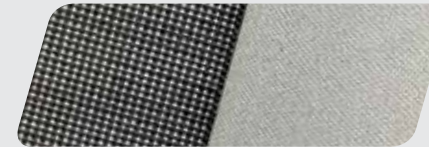
Stoff Design Austin