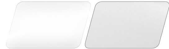
Hochglanz Weiß oder Matt Weiß