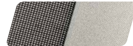
Stoff Design Austin